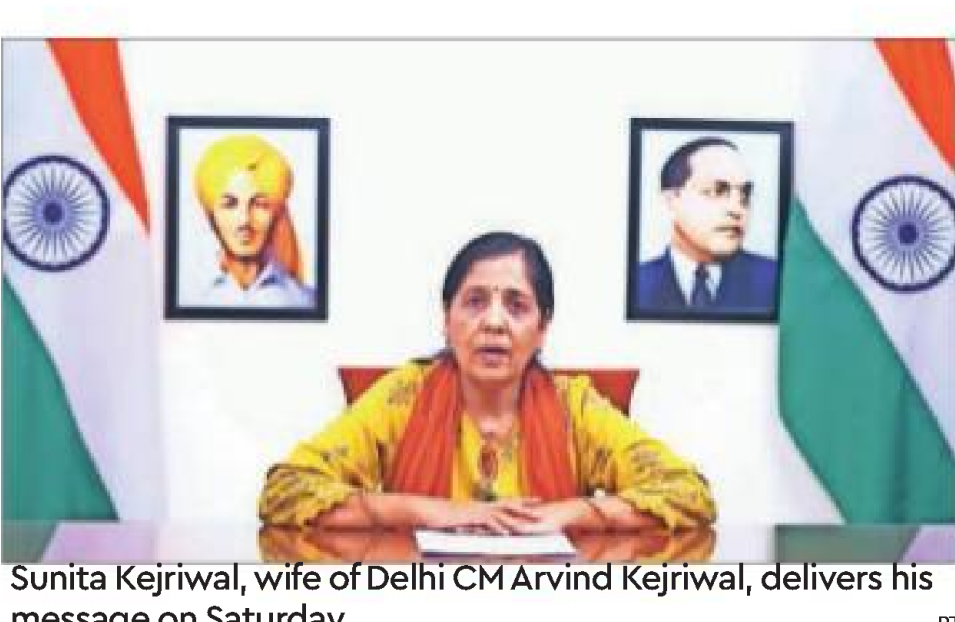
message on Saturday

PRESS TRUST OF INDIA New Delhi, March 23