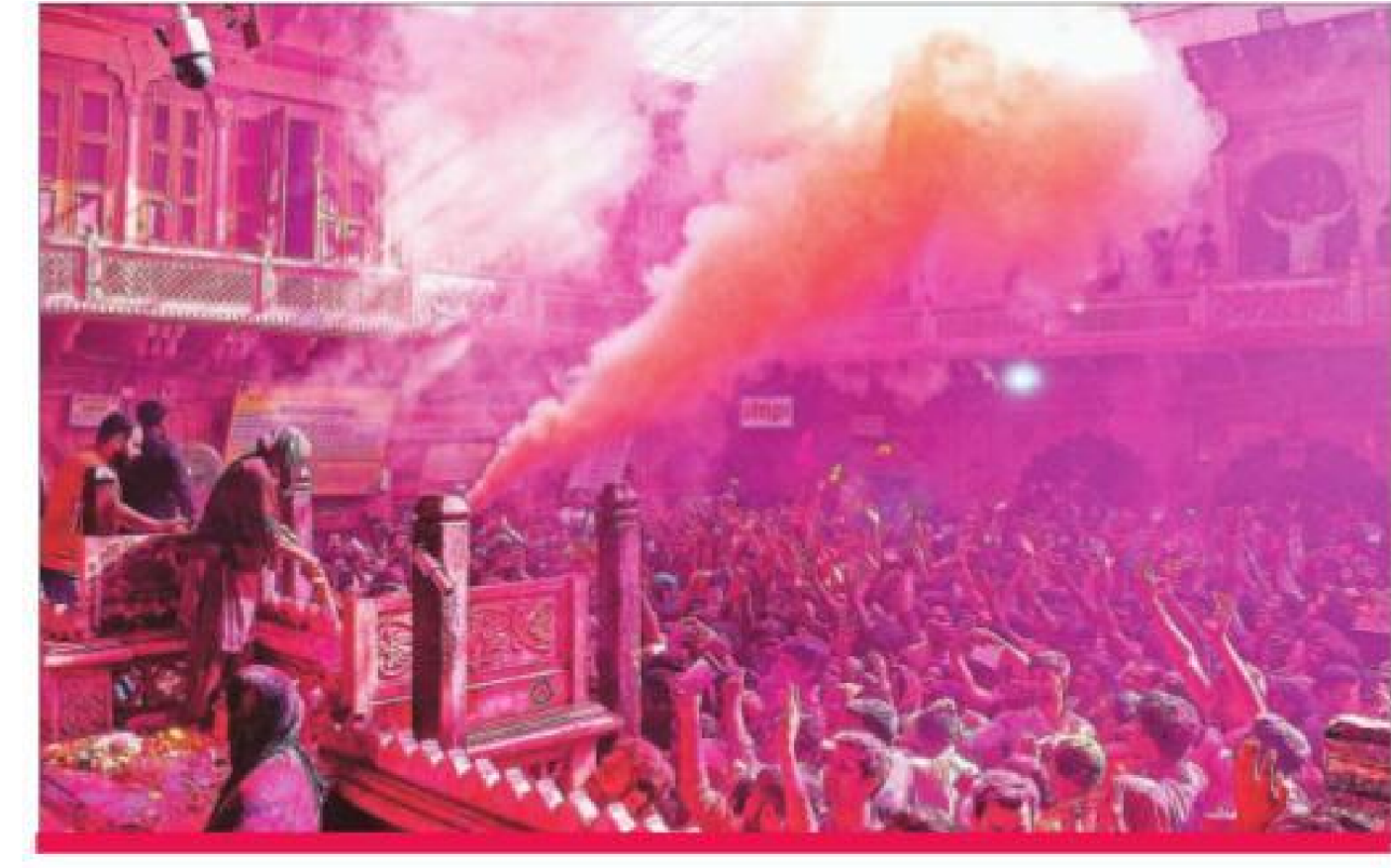
Devotees play Holi at Sri Radha Vallabh temple in Vrindavan near Mathura on Saturday