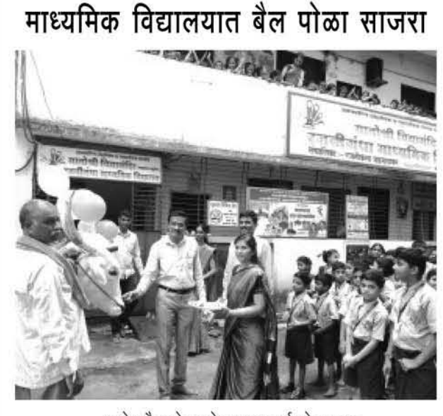
शाळेत बैल पोळा मोठ्या उत्स्फूर्तपणे साजरा.

डोंबिवली: बैल पोळा निमित्ताने डोंबिवली पूर्वेकडील आजदेपाडा येथील मातोश्री विद्यामंदिर व रजनीगंधा माध्यमिक विद्यालयात शेतकऱ्यास बैलांसह बोलावून शाळेत बैल पोळा मोठ्या उत्स्फूर्तपणे साजरा करण्यात आला.