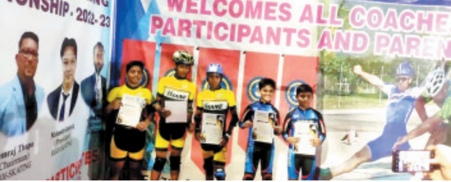
स्केटिंग स्पर्धेत सुवर्ण पदकाची कमाई केलेले खेळाडू.

► कल्याण: रुरल गेम्स ऑफ इंडिया यांच्या वतीने दिनांक ८ जानेवारी रोजी राज्यस्तरीय रोस्कर स्केटिंग स्पर्धा आयोजित करण्यात आली होती. खोपोली येथे आयोजित करण्यात आलेल्या या स्पर्धेत सुमारे ७५० पेक्षा जास्त खेळाडूंनी आपला सहभाग नोंदविला होता.