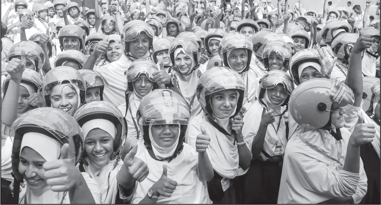
School children of Anjuman-I-Islam wear helmets to create awareness for road safety, in Mumbai on Tuesday.