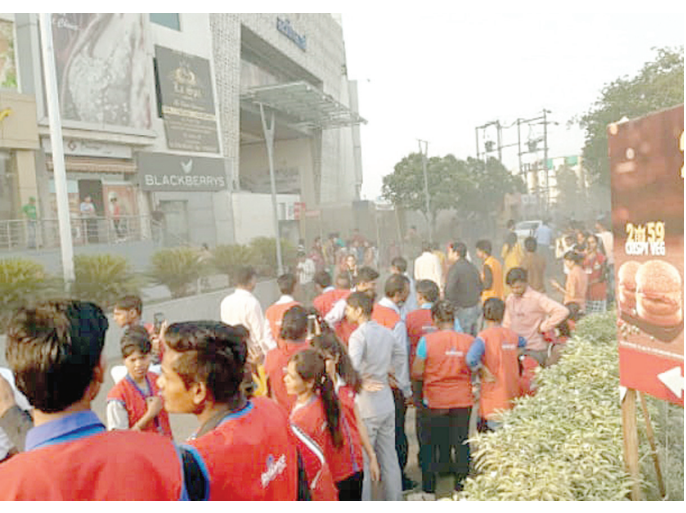
मॉल को खाली कराए जाने के बाद शोरूम के कर्मचारी बाहर खड़े हुए।

स्वदेश संवाददाता, भोपाल भोपाल के होशंगाबाद रोड स्थित आशिमा मॉल बुधवार शाम को आग लगने से अफरा-तफरी मच गई। आग दूसरी मंजिल में स्थित फूड कोर्ट के पास लगी थी। आग से फूड कोर्ट की कुछ दुकानों के साथ एक कपड़े की दुकान को भी अपनी चपेट में ले लिया था। आग तीसरी मंजिल तक भी वॉयर के जरिए पहुंच गई थी। बताया जाता है कि