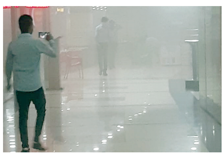
आग से मॉल के दूसरी और तीसरी मंजिल पर धुआं में कुछ नहीं दिख रहा।