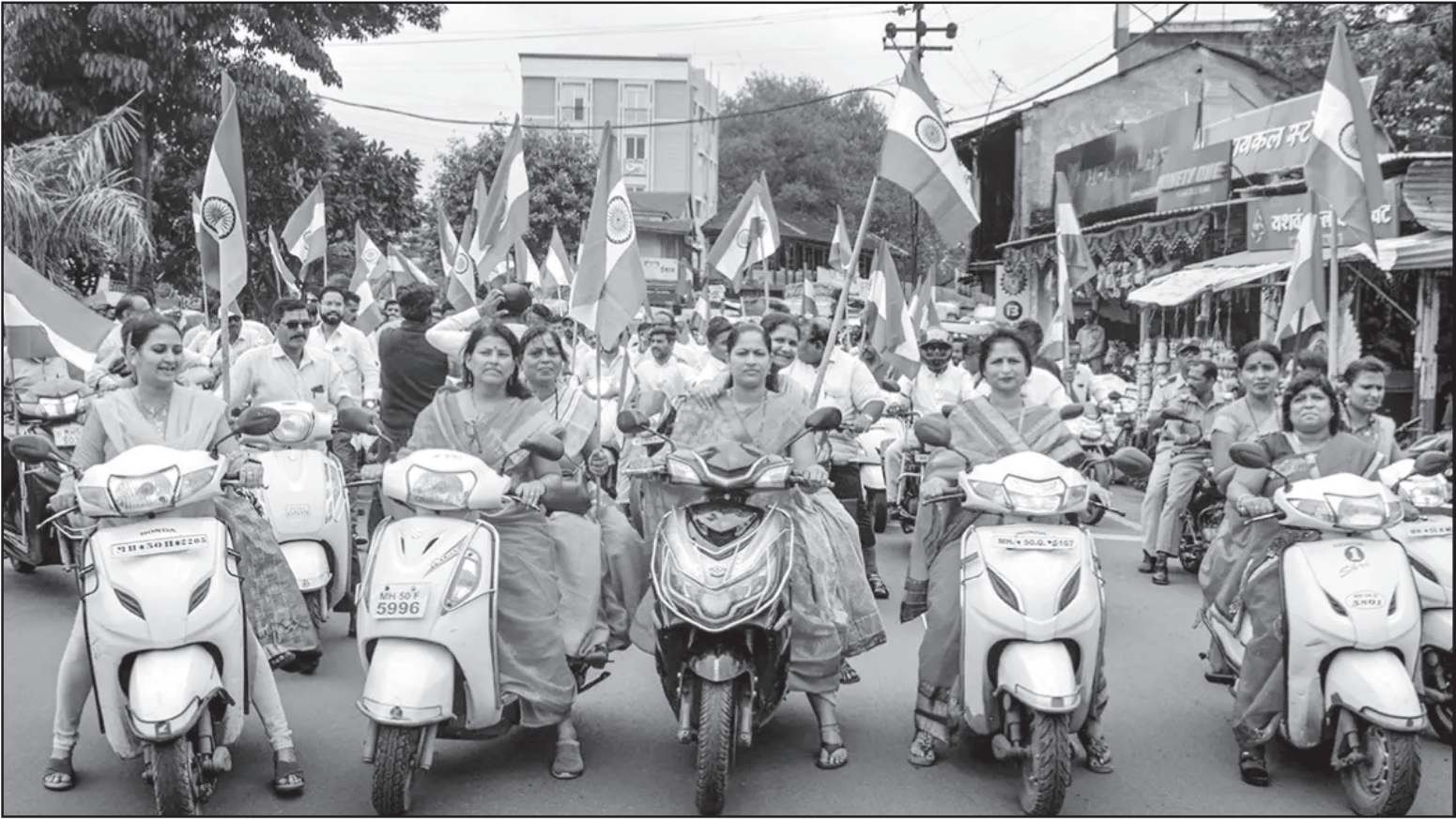
Bharatiya Janata Party (BJP) workers take part 'Tiranga Bike Rally' organised as part of 'Azadi Ka Amrit Mahotsav' celebrations, in Karad on Wednesday..

The clarification has been issued in the wake of claims being made on social media that poor are being forced to buy the flag forcibly to buy ration on the instructions of the Government of India.