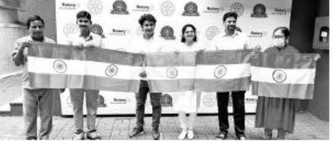
डॉ.श्रीकांत शिंदे फाउंडेशन तर्फे शहरात अकरा हजार झेंडे वाटप