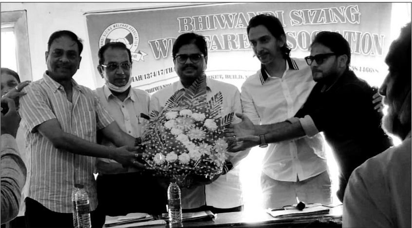
मालाची भाव वाढ झाली पाहिजे ,त्या सोबतच