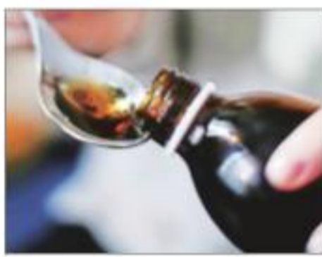
(CDSCO) has proposed testing the drugs (finished products) at government labs before exporting, official sources said.

The apex drug regulatory authority, the Central Drugs Standard Control Organisation