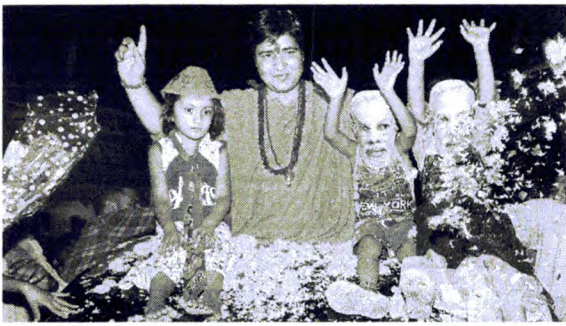
मुंबई में गोडसे का जन्मदिन मनाया जा रहा है।

प्रधानमंत्री मोदी ने एक निष्ठा टोपी के तहत का साक्षात्कार में गोडसे की निंदा करते हुए टिप्पणीय पर नाराज़ी बर्कर की। प्रधानमंत्री मोदी ने इस साक्षात्कार में कहा, 'गांधी और गोडसे को लेकर का यह टिप्पणीय निन्दनीय, पूर्णतः और मजबूत मजबूत के अनुपम है। ऐसे बयान कहने वाले लोगों को सही बयान मानना चाहिए। उनका माफ़ी मांग लेना अलग बात है लेकिन मैं उन्हें कभी भी रिडिम से माफ नहीं कर पाऊंगा।'