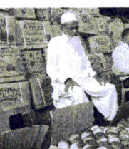
करोड़ रुपये की सब की अर्थव्यवस्था में करीब 4 लाख लोग लगे हुए हैं।

हिमाचल प्रदेश की प्रमुख नकदी फसल सब के लिए राजनीतिक दलों से खफा सब किसान हैं।