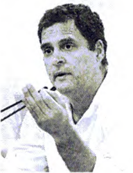
राहुल गांधी बोले, हिंसा के फलस्फुट में शकल कर रहे नरेंद्र मोदी

मौजूदा और संभावित सहयोगियों के बारे में शाह ने केवल इतना कहा कि जब पार्टी 23 मई को सरकार बनाएगी तो मौजूदा सहयोगी दल उसका हिस्सा होंगे और हमारे द्वारा जे उसका हिस्सा के लिए खुले हैं जो हमारे मिशन और नीतियों का समर्थन करेंगे। शाह कई सवालों पर मौन रहे।