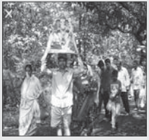
गणपतीला कोकणवासीयांसाठी बोरिवली मार्गे विशेष गाडी सोडण्यास मान्यता द्या

मुंबई : पुढच्या महिन्यात दि. 22 ऑगस्टला गणपती उत्सव आहे. कोकणातील चाकरमाती आपल्या गावी गणपती उत्सव साजरा करण्यासाठी आवजून जातात. थंदा गणेशोत्सव जरी कोरोनाचे सावट असले तरी, निरामय पालन करून कोकणवासीयांसाठी बोरिवली, वसई, दिवा, पनवेल अशी विशेष गाडी सोडण्यात यावी, अशी आग्रही मागणी उत्तर मुंबईचे भाजपा खासदार गोपाळ शेट्टी यांनी केंद्रीय रेल्वे मंत्री प्रियंका गोयल यांना केली होती. कोकण रेल्वे मार्गावर अधिक चांगल्या सुविधा देण्यासाठी केंद्रीय रेल्वे मंत्रालयात याबाबतची मागणी केल्यास केंद्र सरकारकडून गाडी सोडण्यास मान्यता देण्यात येईल असे आश्वासन रेल्वे मंत्रालयात यावेळी दिले होते अशी माहिती त्यांनी दिली.