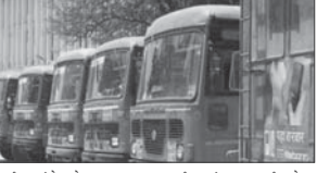
कर्मचाऱ्यांचे वेतन अत्यल्प मिळत आहे. वेतन वेळेवर कटौती होऊन बसले आहे. एसटी महामंडळाच्या कर्मचाऱ्यांना माघ महिन्यात ७५ टक्के, मे महिन्यात ५० टक्के इतके वेतन मिळाले. जून महिन्यात वेतन मिळालेले नाही. एसटी

मुंबई : एसटी महामंडळातील ९८ हजार कर्मचाऱ्यांना मागील दोन महिन्यांपासून वेतन नाही. मे महिन्यात ५० टक्के वेतन देण्यात आले. जुलैचे वेतन मिळाले नाही. कर्मचाऱ्यांना वेतन देण्यासाठी राज्य सरकारने तत्काळ निधी घ्याऊ, अशी मागणी महाराष्ट्र एसटी कर्मचाऱ्यांनी करीस आरंभिली आहे. एसटी महामंडळाच्या कर्मचाऱ्यांना माघ महिन्यात ७५ टक्के, मे महिन्यात ५० टक्के इतके वेतन मिळाले. जून महिन्यात वेतन मिळालेले नाही. एसटी