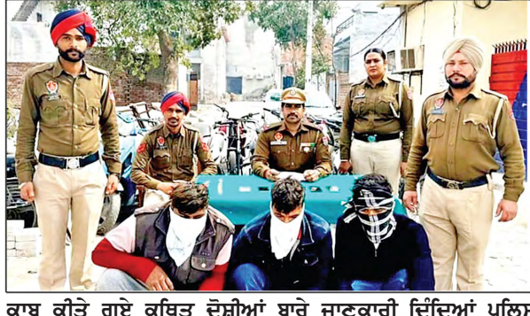
ਕਾਬੂ ਕੀਤੇ ਗਏ ਕਥਿਤ ਦੋਸ਼ੀਆਂ ਬਾਰੇ ਜਾਣਕਾਰੀ ਦਿੰਦਿਆਂ ਪੁਲਿਸ ਅਧਿਕਾਰੀ।

ਸਪਲਾਈ ਕਰਨ ਆਇਆ ਸੀ। ਪਿਛਲੇ ਕਾਫ਼ੀ ਸਮੇਂ ਤੋਂ ਉਕਤ ਕਥਿਤ ਦੋਸ਼ੀ ਵਿਹਲਾ ਹੀ ਰਹਿੰਦਾ ਹੈ ਅਤੇ ਨਸ਼ਾ ਤਸਕਰੀ ਕਰਦਾ ਆ ਰਿਹਾ ਹੈ। ਉਨ੍ਹਾਂ ਦੱਸਿਆ ਕਿ ਉਕਤ ਵਿਦੇਸ਼ੀ ਨਾਗਰਿਕ ਖਿਲਾਫ ਥਾਣਾ ਭੋਗਪੁਰ ਵਿਚ ਸਾਲ 2019 ਵਿਚ ਪੁਲਿਸ ਨੇ ਉਸ ਨੂੰ ਗ੍ਰਿਫਤਾਰ ਕੀਤਾ ਸੀ, ਪਰ ਅਦਾਲਤ ਵਿਚ ਪੇਸ਼ ਨਾ ਹੋਣ ਕਾਰਨ ਉਹ ਭਗੌੜਾ ਕਰਾਰ ਦਿੱਤਾ ਗਿਆ ਸੀ। ਉਨ੍ਹਾਂ ਨੇ ਦੱਸਿਆ ਕਿ ਇਕ ਹੋਰ ਮਾਮਲੇ ਵਿਚ ਵੀ ਇਹ ਕਪੂਰਥਲਾ ਦੀ ਅਦਾਲਤ ਵਿਚ ਭਗੌੜਾ ਹੈ। ਉਨ੍ਹਾਂ ਦੱਸਿਆ ਕਿ ਕਥਿਤ ਦੋਸ਼ੀ ਆਪਣੀ ਪਤਨੀ ਦੀ ਬਿਮਾਰੀ ਦਾ ਇਲਾਜ ਕਰਵਾਉਣ ਲਈ ਕਾਫ਼ੀ ਸਮਾਂ ਪਹਿਲਾਂ ਭਾਰਤ ਆਇਆ ਸੀ ਤੇ ਮੁੜ ਕੇ ਇੱਥੇ ਹੀ ਰਹਿਣ ਲੱਗ ਪਿਆ। ਉਸ ਪਾਸੋਂ ਹੋਰ ਵੀ ਪੁੱਛ ਪੜਤਾਲ ਕੀਤੀ ਜਾ ਰਹੀ ਹੈ, ਕਈ ਹੋਰ ਪ੍ਰਗਟਾਵੇ ਹੋਣ ਦੀ ਸੰਭਾਵਨਾ ਹੈ।