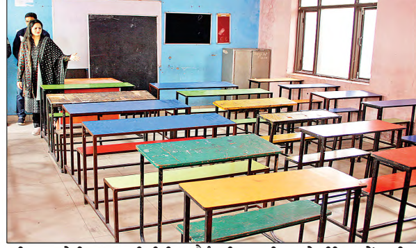
ਲੁਧਿਆਣਾ ਦੇ ਇਕ ਸਰਕਾਰੀ ਸੀਨੀਅਰ ਸੈਕੰਡਰੀ ਸਕੂਲ ਵਿਚ ਬਣੇ ਪ੍ਰੀਖਿਆ ਕੇਂਦਰ ਵਿਚ ਪ੍ਰੀਖਿਆ ਦੇ ਕੀਤੇ ਪ੍ਰਬੰਧ ਦਿਖਾਉਂਦੇ ਹੋਏ ਸਕੂਲ ਦੀ ਪ੍ਰਿੰਸੀਪਲ।