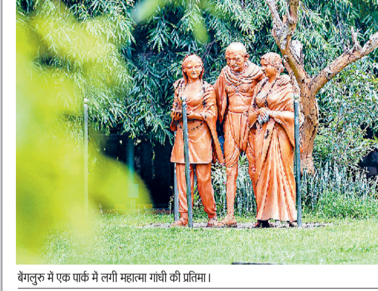
बंगलुरु में एक पार्क में लगी महात्मा गांधी की प्रतिमा।