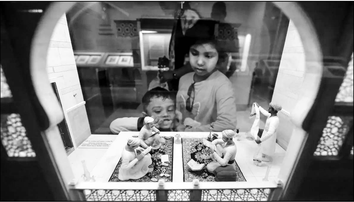
Children visit the Chhatrapati Shivaji Maharaj Museum on International Museum Day, in Mumbai on Wednesday.