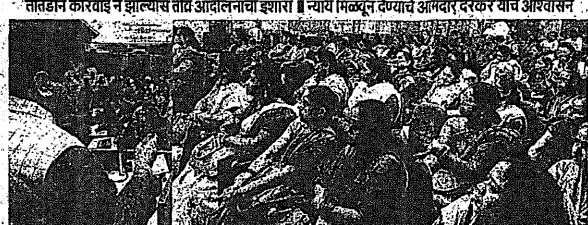
मुंबई येथील एल्गार महिला आंदोलनाचा एक दृश्य. महिलांनी सरकारच्या पोषण आहाराच्या बिले रखडवण्याच्या बाबतून प्रतिकार केला आहे.

पोषण आहाराच्या बिले रखडवण्याबाबत महिलांनी सरकारच्या पोषण आहाराच्या बिले रखडवण्याबाबत प्रतिकार केला आहे. पोषण आहाराच्या बिले रखडवण्याबाबत महिलांनी सरकारच्या पोषण आहाराच्या बिले रखडवण्याबाबत प्रतिकार केला आहे.