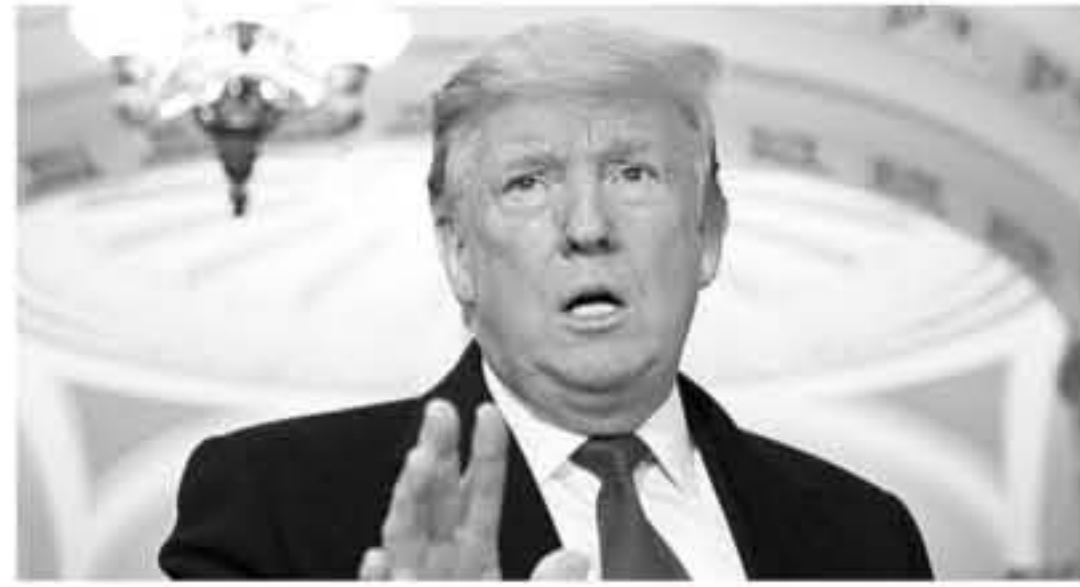
ఎగుమతులపై పెద్దగా ప్రభావం ఉండని భారత్ లోని వాణిజ్య నిపుణులు అభిప్రాయ వ్యక్తం చేశారు. భారత్ జీఎస్టీలో భాగంగా ఉండటంతో 2017లో 5.6 బిలియన్ డాలర్ల విలువైన ఉత్పత్తులను అమెరికాకు ఎగుమతి చేసింది. వచ్చే ఏడాది జీఎస్టీలో జీ-20 సభ్య దేశాల సదస్సు జరుగుతుంది. ఈ సదస్సుకు అమెరికా అధ్యక్షుడు డొనాల్డ్ ట్రంప్, భారత్ ప్రధాని మోడీ కూడా హాజరు కానున్నారు. ఈ సదస్సులో ఇరుదేశాధినేతలు ఈ అంశంపై చర్చించే అవకాశముంది.

వాషింగ్టన్: భారత్ కు ప్రాధాన్య వాణిజ్య హోదా(జీఎస్టీ) తొలగింపు విషయంలో వెనక్కి తగ్గింది. ట్రంప్ సర్కార్ పునరుద్ధరించింది. భాషా సేవకు లోని ఎన్ని అంశాల విజయాలకు కుట్రాంశాలు తెలిపిన అమెరికా... మోడీ ప్రభుత్వంలో కలిసి పనిచేయడానికి సంసిద్ధతను వ్యక్తం చేసిన మునుపటి రోజు ఈ ప్రకటన వెలువడడం గమనార్హం. భారత్ కు జీఎస్టీ హోదా రద్దు జులైలో ముగిసిన ప్రక్రియ అని అధికారులు పేర్కొన్నారు. ఈ విషయంలో అమెరికా ఇచ్చిన 60 రోజుల గడువు మే 3తో ముగిసింది. అయితే, భారత్ లో సాంకేతిక ఎన్నికల ముగిసిన తరువాత జీఎస్టీ రద్దుపై ఎటువంటి నిర్ణయం తీసుకోవచ్చని కొందరు యూఎస్ కాంగ్రెస్ సభ్యులు కోరడంతో డీని సై తదుపరి నిర్ణయం ఆగిపోయింది. భారత్ లో పాటు టర్కి కుడా విధించిన గడువు ముగియడంతో మే 17న అదేశానికి జీఎస్టీ హోదాను రద్దు చేసినట్లు ట్రంప్ ప్రకటించారు.