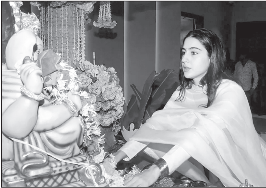
Bollywood film actor Sara Ali Khan offers prayers to Lord Ganesha during 'Ganesh Chaturthi' celebrations, in Mumbai.

The Maharashtra government had not granted sanction to prosecute the four policemen. Yunus's mother challenged the state's decision before the Supreme Court after the Bombay High Court declined to interfere.