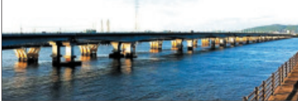
वाशी खाडी पुल