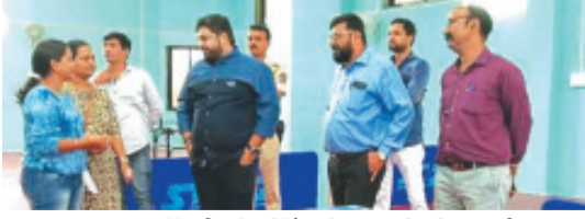
खासदार डॉ. श्रीकांत शिंदे यांच्या मार्गदर्शनाखाली खेळाडूंना सोयीसुविधा देण्यास सुरुवात