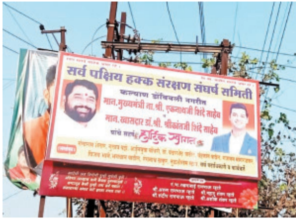
मुख्यमंत्री एकनाथ शिंदे यांच्या स्वागताचे बॅनर लावल्याने शहरात चर्चा.

या चर्चित विषयाबाबत सर्व पक्षीय हक्क संरक्षण समितीचे सचिव