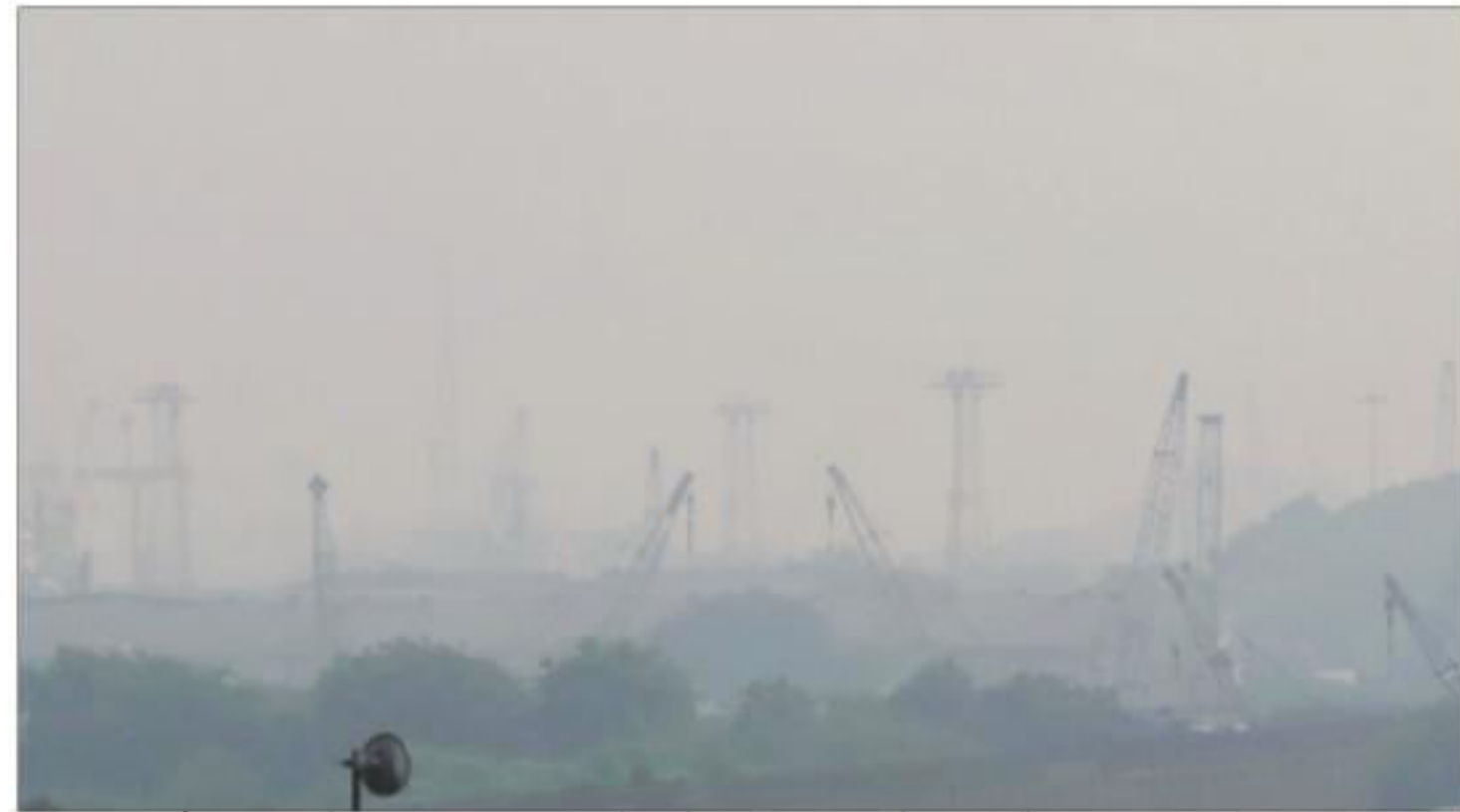
Winter is far away, but construction dust has worsened air quality.

Canada said India's decision will impact the levels of services to consulates in both countries. "Unfortunately, we have to put a pause on all in-person services in our consulates in Chandigarh, in Mumbai and in Bangalore," Joly said. "Canadians who need consular assistance can still