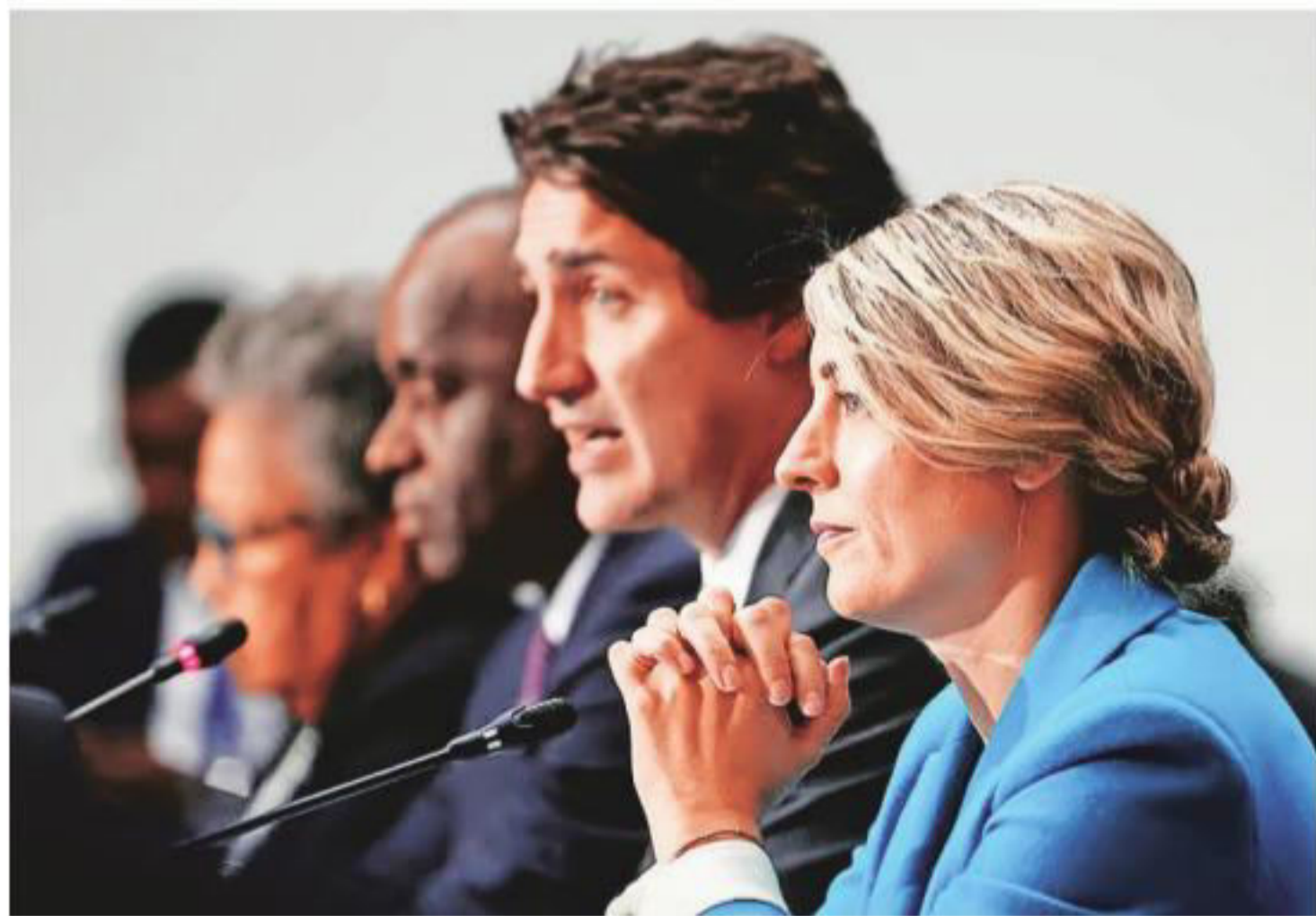
Canada's Foreign Minister Melanie Joly and Prime Minister Justin Trudeau in Ottawa on Wednesday.

Delhi had asked Ottawa to withdraw about 40 of its diplo-