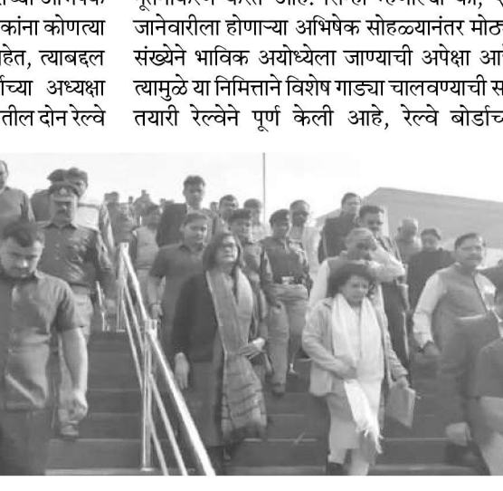
अध्यक्षांनी अयोध्या स्थानकावर रेल्वे आणि नागरी अधिकाऱ्यांसोबत भाविकांना पुरवल्या जाणाऱ्या सुविधांबाबत विचारमंथन सत्र आयोजित केले होते, त्यावेळी त्यांनी ही माहिती दिली.