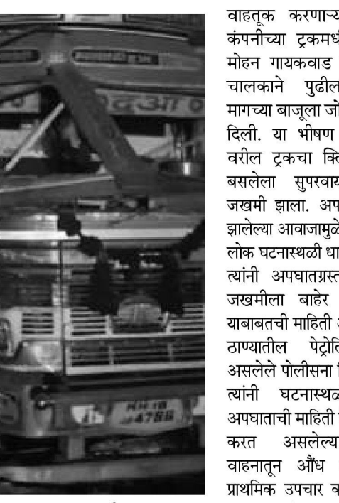
गाडीने पाठीमागून जोरदार धडक दिली. या धडकेत एका जण भीमर जखमी झाला, त्याचेवडी पाठीमागून नुकसान झाले आहे. खटाव तालुक्यातील वडी गावच्या हद्दीत आयशर कंपनीचा ट्रक हा समोर स्पॅड ब्रेकर असल्याने हळू जात होता, त्याचेवडी पाठीमागून सुसाट वेगाने आलेल्या गाववाडी डेअरीचे धुव व दुग्धजन्य पदार्थ

क्राड : राज्य, राष्ट्रीय महामार्ग असो की सामान्य शहर, गावांतील रस्ते असो या रस्त्यांवरील अपघात केवळ अनावधानाने होऊन असे नसून यामध्ये अनेक अपघात केवळ मध्यधुंद चालकांनी वाहन चालविल्याने होतात हे अनेक घटनांवरून स्पष्ट झाले आहे. यामध्ये रात्रीच्यावेळी मध्यांऊन गाडी चालवणाऱ्यांचे प्रमाण तर भलतेच वाढले आहे. यामुळे या मानवनिर्मित अपघाताच्या देखील घटनाही वाढल्या आहेत. अशीच एक अपघाताची घटना मंगळवारी रात्री खटाव तालुक्यातील वडी या गावानजीक घडली असून तेथील एका पुलाचे काम सुरू असल्याने त्या कामापासून सुमारे १०० मिटरवर दोन्ही बाजूंना स्पॅड ब्रेकर करण्यात आलेले आहेत. तरीही या अडथळ्यांना न जुमानता या स्पॅड ब्रेकरवरून मंगळवारी रात्री समोर चाललेल्या ट्रकला एका दूध वाहतूक करणाऱ्या