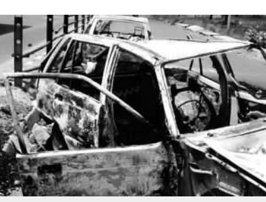
Mandsaur in 2017, a few days after the LEGACY OF AN AGITATION

won seven of the eight seats in Mandsaur, 18 months. "Over the years, the victims'