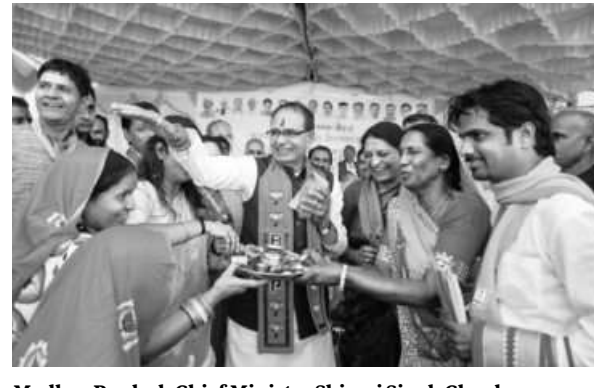
However, at the start of the Madhya Pradesh Chief Minister Shivraj Singh Chauhan (centre) with supporters during a public meeting ahead of the state elections in Raigarh district

three Union ministers and a party general secretary, per-Chouhan wasn't the face of the campaign. Until 2018, the chief minister led the pre-election "Jan Ashirwad Yatra" campaign. This time, the party organised five campaigns with five different leaders.