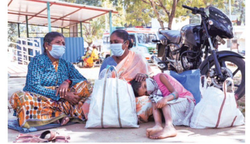
A scene outside a hospital in Chikkamagaluru, Karnataka, on Sunday