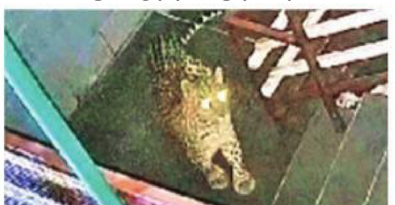
குடியிருப்பு பகுதியில் நுழைந்த சிறுத்தை (சிசிடிவி கேமராவில் பதிவான படம்).

உதகை, நவ. 7 : குன்னூரில் வீட்டின் கேட்டை தாண்டி உள்ளே நுழைந்த சிறுத்தை, அங்கிருந்த வளர்ப்பு நாயை விரட்டிச் செல்லும் காட்சி அங்குள்ள சிசிடிவி கேமரா வில் பதிவாகியுள்ளது. இதனால் அப்பகுதி மக்கள் அச் சமடைந்துள்ளனர்.