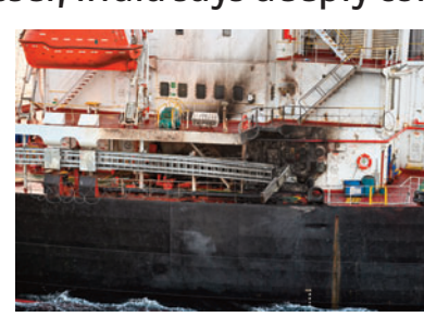
NS Visakhapatnam swiftly responded to

There was no report of any casualties and the fire on the vessel was contained. officials said. The Indian Navy's frontline warship INS Visakhapatnam responded within an hour to the distress call by M V Genco Picardy following the drone attack at 2311 hours on Wednesday, they said.