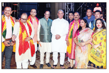
रोटरी क्लब जल स्वच्छता, पोलियो उन्मुलन और शिक्षा को बढ़ावा देने में सदैव अग्रणी रहा है।