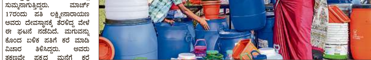
ನೀರಿನದ್ದೇ ತಲೆಬಿಸಿ: ಬೀಟಿಯಲ್ಲಿ ನೀರಿನ ಬವಣೆ ತಪ್ಪಿಸಲು ಮನೆಯಲ್ಲಿ ನೀರು ಶೇಖರಿಸಿರುವುದು ಕಾಣಿಸಿ ಮಹಿಳೆಯೊಬ್ಬರು ದೊಡ್ಡ ಪ್ರಮಾಣದ ನೀರನ್ನು ತುಂಬಿರುವ ದೃಶ್ಯ ರಾಜಾಜಿನಗರದಲ್ಲಿ ಕಂಡುಬಂತು.