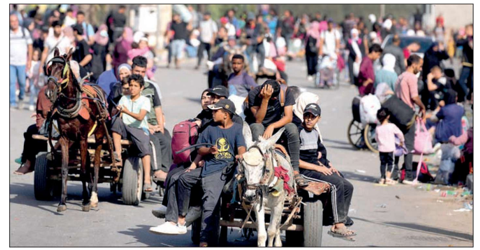
তল্পিতল্পা বেঁধে দলে দলে ঘর ছাড়ছেন গাজার বাসিন্দারা। বৃহস্পতিবার, বুরেজে।

ব্যাঙ্ক অফ ইন্ডিয়া অ্যাসেট রিকভারি ডিপার্টমেন্ট বারাসত জোনাল অফিস তৃতীয় তল, ডিডি–২, সল্টলেক, সেক্টর–১, বিধাননগর, কলকাতা– ৭০০০৬৪