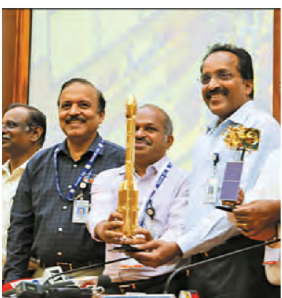
அனுமதிக்கப் போகிறோம். தனியார்

இன்சாட் 3டி மற்றும் இன்சாட் 3 டி.ஆர் சுற்றுப்பாதையில் உள்ளது. வானிலை தொடர்பான தகவல்கள் போன்ற பல்வேறு வளிமண்டல அளவுகளை கண்காணிக்கும் திறனை இன்சாட் டி.எஸ் அதிகரிக்கும். அறிவியல் ் 3வது தொடரான சேகரிப்புக்கு மற்றும் கரவு இது பேரிடர் பயன்படுத்தப்படும். காலங்களில் துணை புரிகிறது. ஒவ்வொரு 15 நிமிடங்களுக்கும் முழு நாட்டையும் படம் பிடிக்கும். ஜி.எஸ்.எல்.வி. மீண்டும் வெற்றியடைந்தது. தோல்விக்குப் பிறகு 2 வெற்றிகரமான பணிகள் ஜி.எஸ்.எல். நடந்துள்ளன. പങ്ങി வி.யின் அடுத்த நாசாவின் ஒத்துழைப்புடன் நிஷார் செயற்கைகோள் வெற்றிகரமாக நடக்க உள்ளது இஸ்ரோ செயற்கைகோள் இது அல்ல. இஸ்ரோ தொழில்நுட்பத்தை தனியார் பயன்படுத்த துறையை