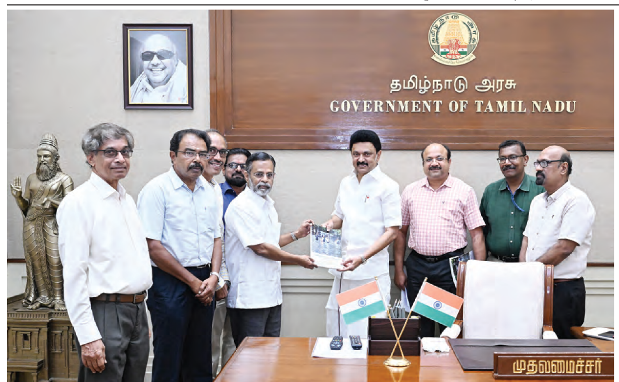
முதலமைச்சா் மு.க.ஸ்டாலினை, சென்னை மற்றும் அதன் புறநகா் பகுதிகளில் மழை வெள்ள பாதிப்புக்கு நிரந்தர

பயணிப்போம்! இணைந்து வெற்றிபெறச் இந்தியாவை செய்வோம். இவ்வாறு முதலமைச்சர் மு.க.ஸ்டாலின் கூறியுள்ளார்.