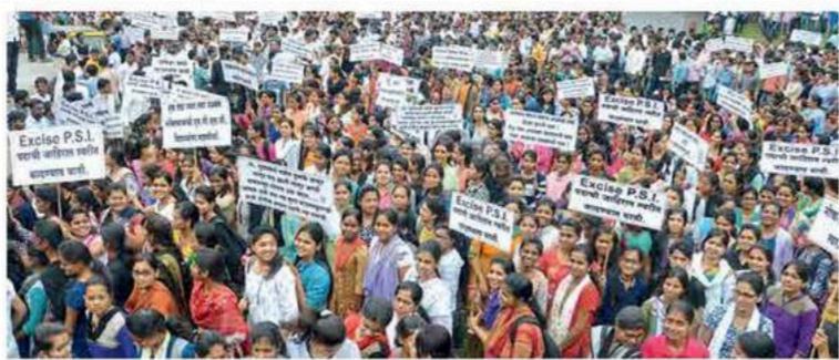
विविध मागण्यांसाठी स्पर्धा परीक्षेची तयारी करणाऱ्या विद्यार्थ्यांनी काढलेला मोर्चा. (प्रतिनिधिक छायाचित्र)

गेल्या काही वर्षांत गैरप्रकारांची मालिका सुरू असून त्यात पोलिस भरती गैरव्यवहार सर्वांत जास्त आहेत. 'दि पब्लिक एम्प्लॉयमेंट प्रिव्हेटन ऑफ अनफेअर मिन्स बिल २०२४' कायद्यामध्ये नोकरभरती व सॉईटमेंटचे प्रश्नांचा नोकरभरतीत व वर्षांपर्यंत कैद आणि दहा लाख रुपये दंडाची तरतूद आहे. शिक्षा पाच वर्षांपर्यंत आणि दंड एक कोटी रुपयांपर्यंत वाढविला जाऊ शकतो. शिवाय संघटित स्वरूपात गुन्हेगारीत भाग घेणाऱ्या संस्थांची मालमत्ता जात होऊ शकते. परीक्षेचा खर्चही अशा संस्थांकडून वसूल केला जाऊ शकतो.