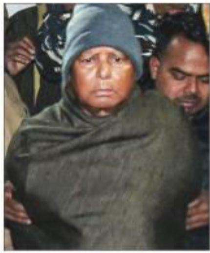
RJD chief Lalu Prasad Yadav leaves from the ED office in Patna on Monday.

A team of ED officials from Delhi reached Patna on Sunday to question the RJD leader in connection with the alleged scam, the sources said. The central agency had on January 19 issued fresh summons for questioning Prasad and his son Tejashwi Yadav. The RJD chief appeared before the central agency a day after JD(U) president and Bihar chief minister Nitish Kumar ditched the ‘Mahagathabandhan’ in which the RJD is the largest constituent, and the opposition