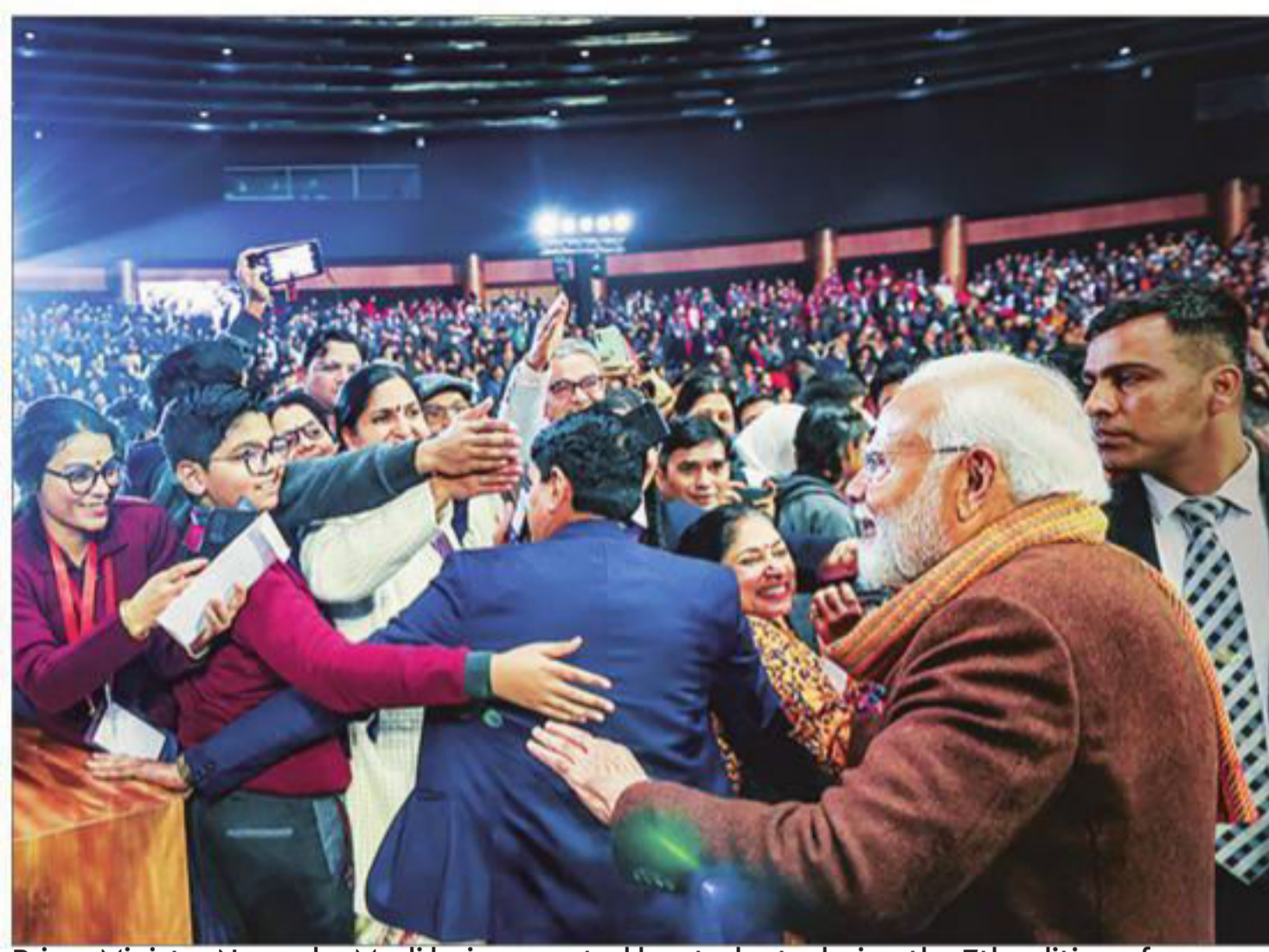
Prime Minister Narendra Modi being greeted by students during the 7th edition of Pariksha Pe Charcha, at the Bharat Mandapam, in New Delhi on Monday