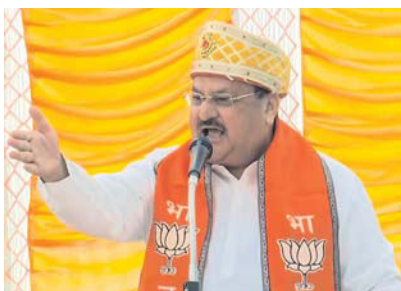
भाजपा अध्यक्ष जेपी नड्डा रतलाम में जनसभा को संबोधित करते हुए।

Seal Sd/- Ld. DJ (Commercial Court)-06, South-East District, Saket Court Complex, New Delhi.