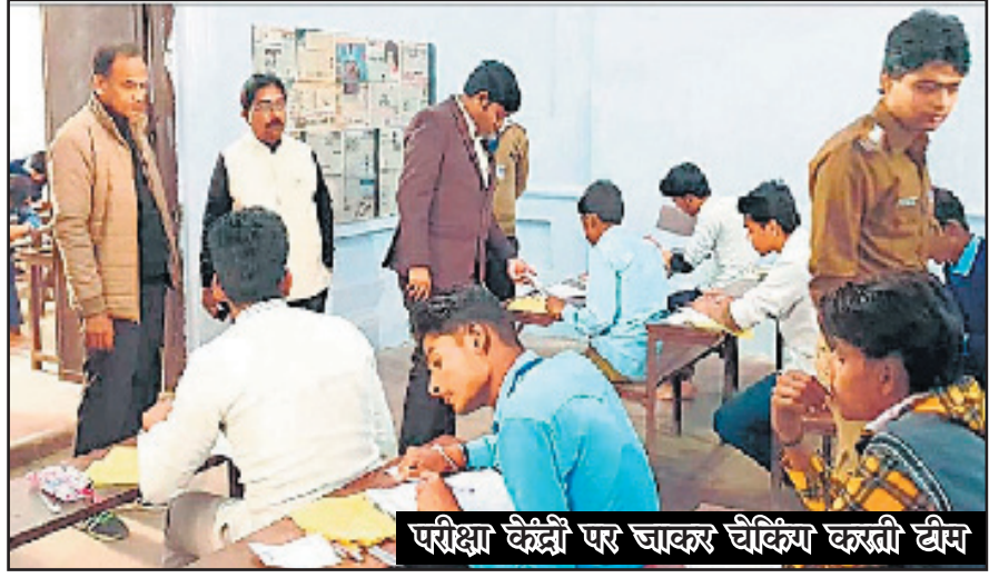
परीक्षा केंद्रों पर जाकर चेकिंग करती टीम