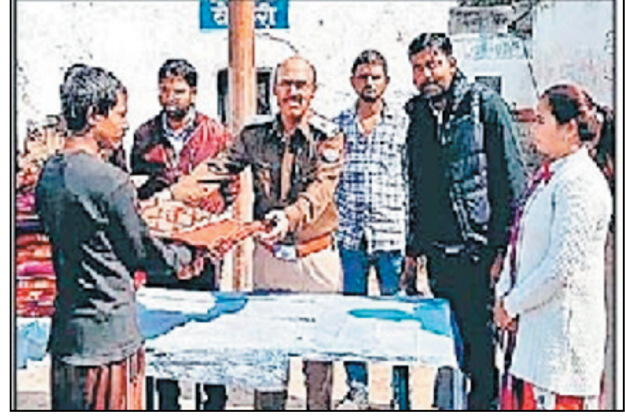
पंख संस्था ने जेल में बंद बंदियों को बांटे कम्बल