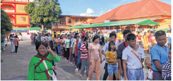
People queue for food at a monastery-turned-temporary shelter for internally displaced people in Lashio, Shan state, on Wednesday

The surrender of 261 people - 127 soldiers and 134 of their family members - from the infantry battalion in northeastern Shan state appears to be the biggest by regular army forces since widespread armed conflict in Myanmar broke out in 2021.