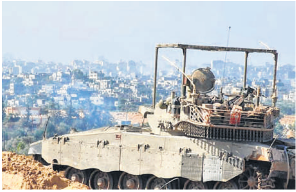
Soldiers in an armed vehicle on a military operation around Al-Shifa hospital in Gaza City

National security spokesperson John Kirby said, "We do not support striking a hospital from the air and we don't want to see a firefight in a hospital where innocent people, helpless people, sick people trying to