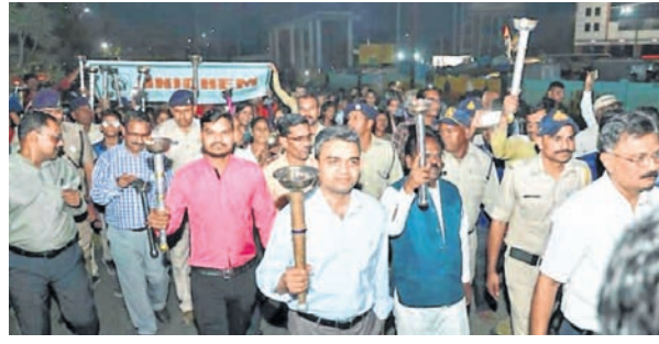
Pithampur (Mhow)