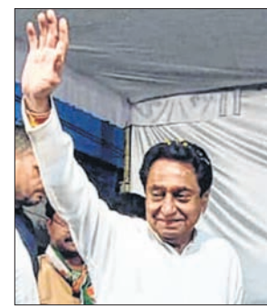
OUR STAFF REPORTER city.bhopal@fpj.co.in

MPCC president Kamal Nath campaigned in Chhindwara only on the last two days before the 2018 election.