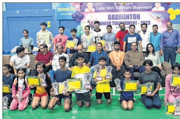
Winners of the badminton championships along with guests and hosts