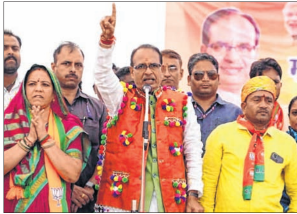
Chief Minister Shivraj Singh Chouhan waves to crowd at a programme held in support of BJP candidates on Wednesday

Congress president Mallikarjun Kharge has sharply reacted to calling Prime Minister Narendra Modi, Chief Minister Shivraj Singh Chouhan, ED, CBI and Income-tax Department as the Pandavas in the current battle of ballots. Taking a jibe at Kharge's reaction, Chouhan said at a public meeting on Wednesday that Kharge had accepted his party as the Kaurav Sena. Whereas the Pandavas fight for justice, the Kauravas do it for selfish motive, Chouhan said. There was one Dhritarashtra in the Mahabharata, but the Congress has two - Digvijaya Singh and Kamal Nath - who want to