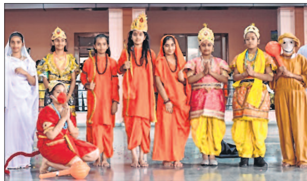
FP NEWS SERVICE Mhow

Saint Mary's Higher Secondary School, Mhow celebrated Diwali, on Wednesday, with festive gusto. The students presented the scene of Lord Rama defeating Ravan and coming back to Ayodhya. The students also gave a meaningful message about killing all the evil existing in society. The school wore a festive look with decorated diyas and rangoli. An inter-house competition of rangoli making was organised for the students. The stunning designs of rangoli made by the students allured and