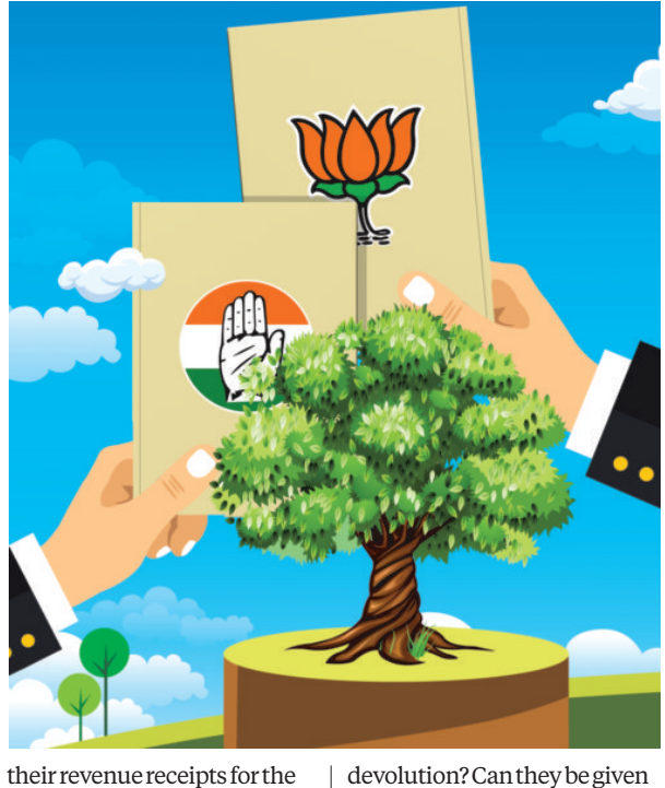
ILLUSTRATION: BINAY SINHA

three years till 2022-23, according to a report by the Reserve Bank of India on PRI finances: non-tax revenues accounted for a bit more than 3 per cent.