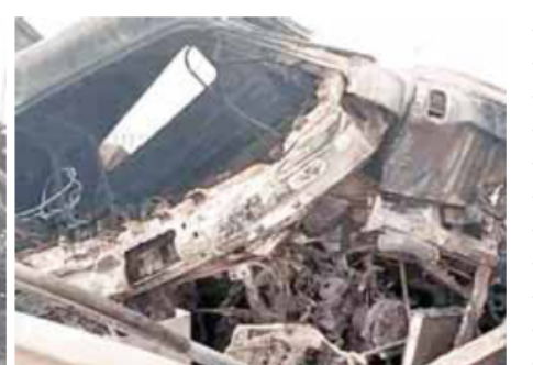
<mark>पायनियर समाचार सेवा।</mark> फरीदाबाद

फरीदाबाद में केएमपी पर अल सुबह एक दर्दनाक हादसा हुआ। कुडली-मानेसर-पलवल एक्सप्रेस-वे पर सुबह लगभग तीन बजे एक टुक अनियंत्रित होकर मौजपुर टोल नाके से टकरा गया। इससे ट्रक में भीषण आग लग गई। आग इतनी तेजी से फैली कि इसमें सवार डाइवर व सहायक को उतरने का मौका ही नहीं मिला और दोनों जिंदा ही जल गए।