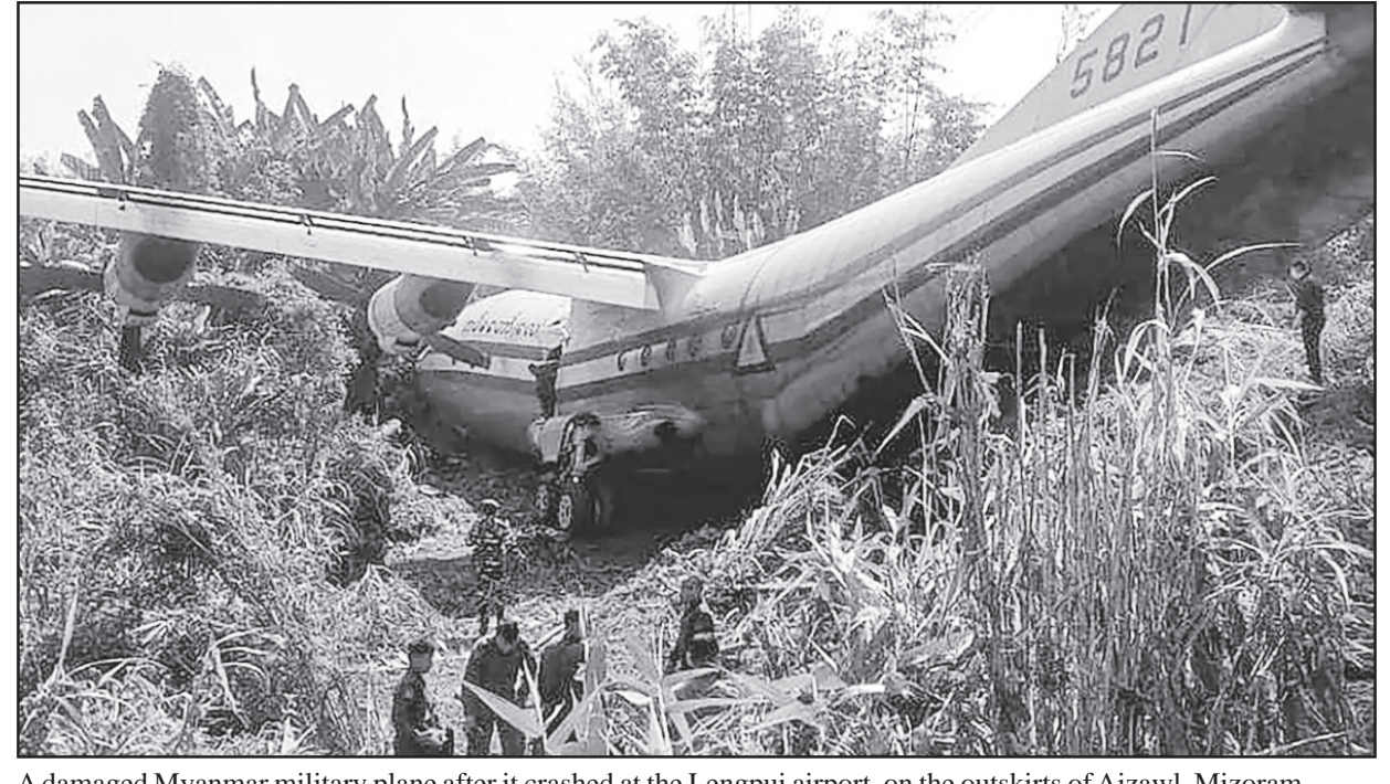
A damaged Myanmar military plane after it crashed at the Lengpui airport, on the outskirts of Aizawl, Mizoram.

I HAVE CHANGED MY OLD NAME FROM BATWALA SHEHBAZAHMED NAZIRAHMED TO NEW NAME BETWALA SHEHBAZAHMED NAZIRAHMED & I WILL BE KNOWN AS NEW NAME WHICH PLEASE NOTE SD:- BETWALA