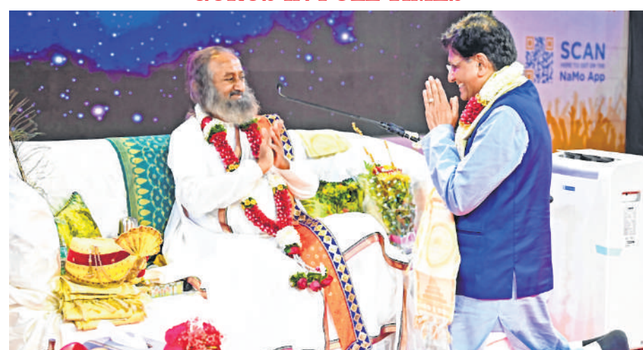
Union Minister of Commerce and Industry Piyush Goyal exchanges greetings with spiritual leader Sri Sri Ravi Shankar during an evening of music and meditation at Viksit Bharat Ambassadors’ event, in Mumbai, on Friday.