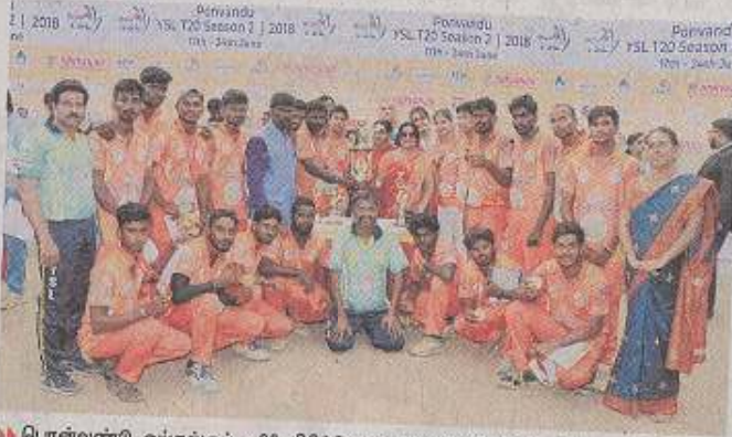
பான்வண்டு ஓய்எஸ்எல் டி20 கிரிக்கெட் போட்டியில் வெற்றி பெற்ற அணிகளுக்கு கோப்பைகள் வழங்கப்பட்டன.

பான்வண்டு ஓய்எஸ்எல் டி20 கிரிக்கெட் போட்டி நிறைவடைந்தது.