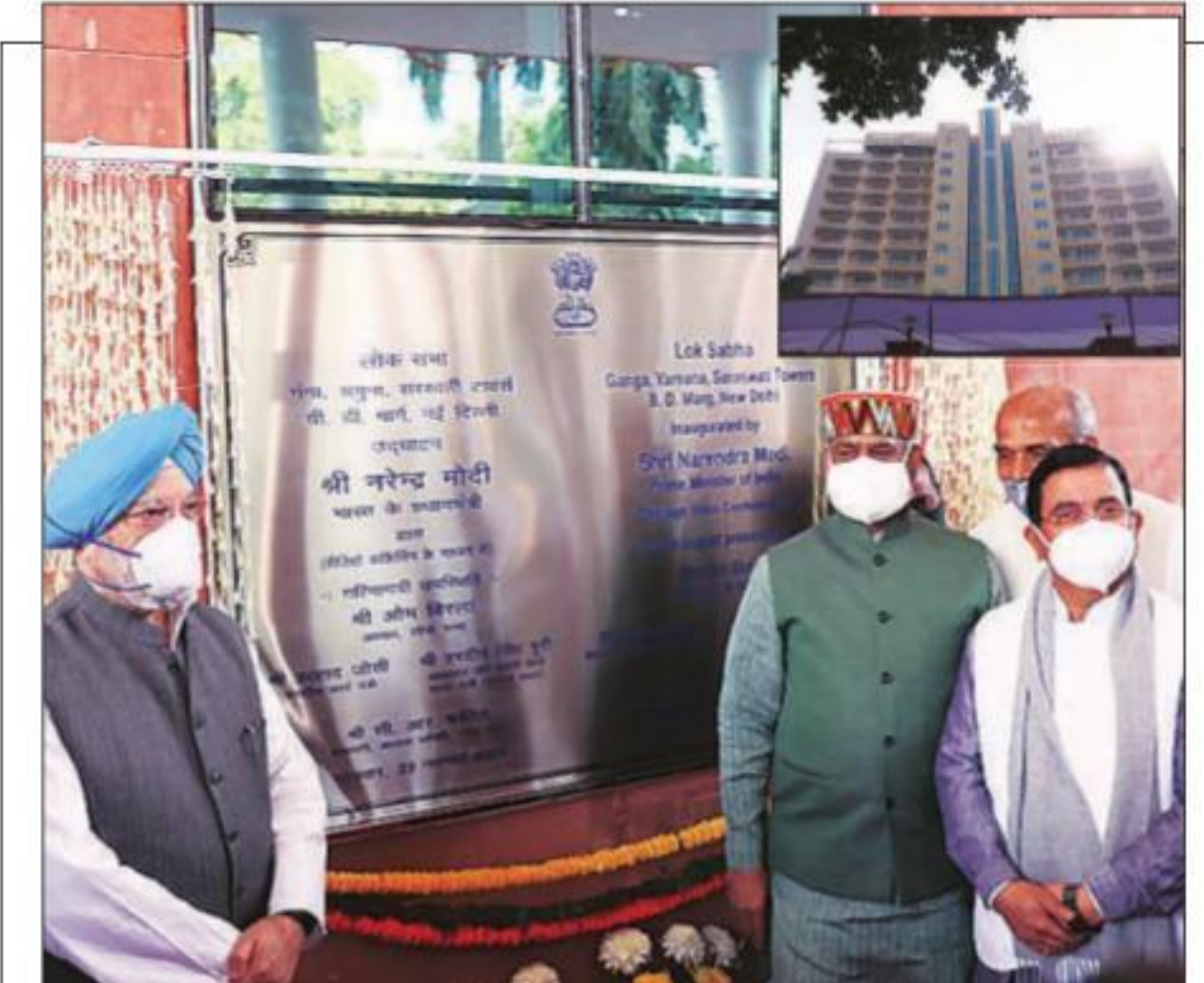
बसेरा राजधानी दिल्ली के डॉ बीडी मार्ग पर सांसदों के नए बहुमंजिला आवास के लोकार्पण पर मौजूद लोकाभ्या अध्यक्ष ओम बिरला, केंद्रीय मंत्री हरदीप सिंह पुरी व अन्य। इनसेट में बहुमंजिला आवास।

पंजाबी बाग थाना क्षेत्र में रविवार को एक कार चालक को दिल्ली नागरिक सुरक्षा (सिविल डिफेंस) के कर्मचारी ने बिना मास्क न लगाने पर रुकने का इशारा किया तो चालक ने कर्मचारी को टक्कर मार दी। घटना के बाद आरोपी चालक मौके से फरार होने की कोशिश कर रहा था, लेकिन मौके पर तैनात अन्य कर्मचारियों ने उसकी कार का वीडियो बनाया शुरू कर दिया और आगे खड़े हो गए। पकड़े जाने की डर से आरोपी ने कर्मचारी को पास के अस्पताल में भर्ती करवाया। इस पूरे घटनाक्रम का वीडियो भी सोशल मीडिया पर वायरल हुआ है। बताया जा रहा है कि इस मामले में फिलहाल पुलिस से कोई भी कार्रवाई नहीं की है। पुलिस का कहना है कि शिक्षायत्र मिलने पर इस मामले में जो भी कानूनी कार्रवाई होगी की जाएगी। पंजाबी बाग में सिविल डिफेंस कर्मचारी बिना मास्क के घूम रहे लोगों के चालान काट रहे हैं।