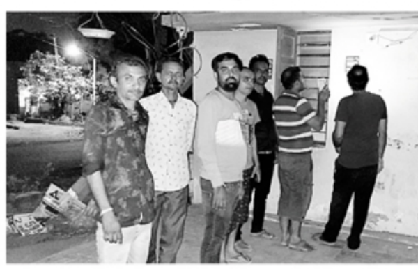
અંજાર પી.જી.વી.સી.એલ. કચેરીમાં રાત્રિના સમયે કરિયાદ નોંધાવવા આવેલા ગ્રાહકો તસવીરમાં નજરે પડે છે.

મોડી રાત્રિના સમયે પી.જી.વી.સી.એલ. કચેરીની ફરિયાદીબારીમાં રોષ ઠાલવવા આવેલા ગ્રાહકોએ જશાવ્યું હતું કે, પી.જી.વી.સી.એલ. કચેરીના પાછળના ભાગના વિસ્તારમાં આવેલી રહેશાક વસાહતમાં