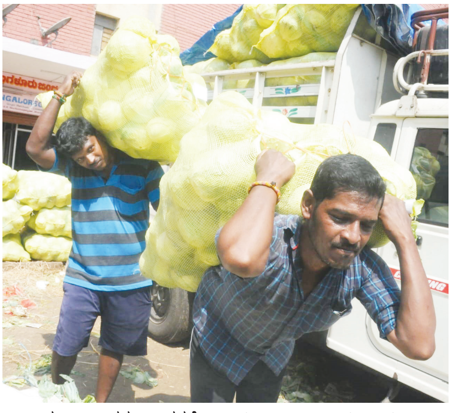
ಇಂದು ಕಾರ್ಮಿಕರ ದಿನಾಚರಣೆ.....ಆದರೆ ಈ ಕಾರ್ಮಿಕರು ಅವನ್ನೆಲ್ಲಾ ಮರೆತು ಪ್ರತಿ ದಿನದಂತೆ ತಮ್ಮ ಕಾರ್ಯದಲ್ಲಿ ತೊಡಗಿರುವುದು.