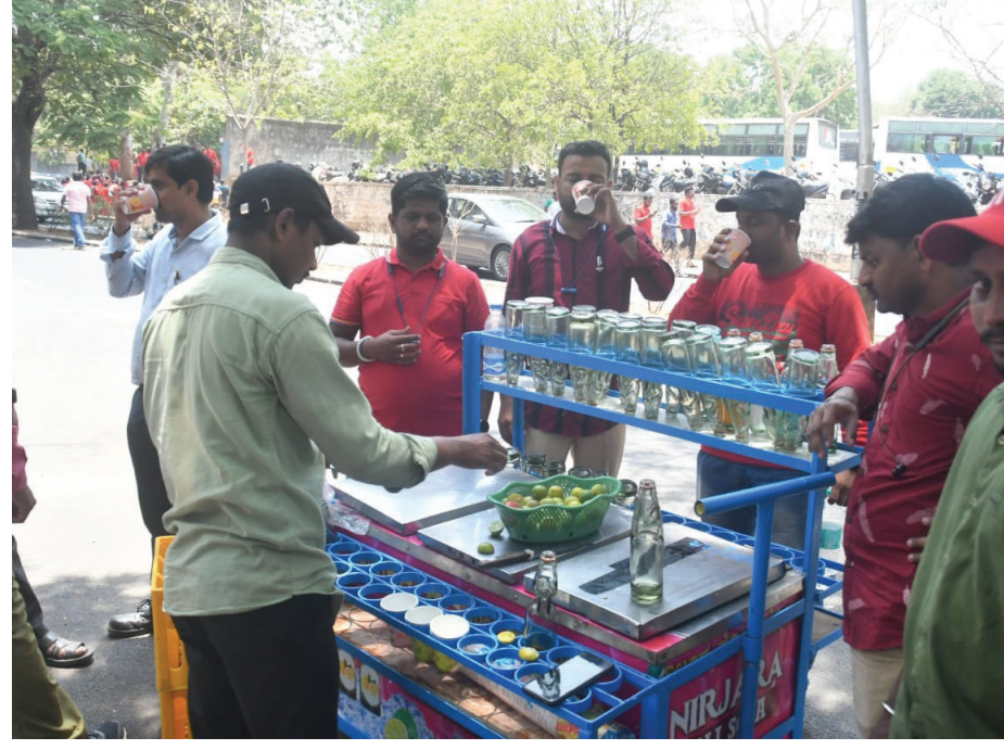
ನಗರದಲ್ಲಿ ಬಿಸಿಲಿನ ಬೆಗೆ ದಿನೇ ದಿನೇ ಹೆಚ್ಚಳವಾಗುತ್ತಿದ್ದು ಬಾಯಾರಿಕೆ ನೀಗಿಸಿಕೊಳ್ಳಲು ಜನರು ನಿಂಬು ಸೋಡಾ ಮೊರೆ ಹೋಗಿದ್ದಾರೆ.