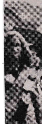
had gathered Sunday