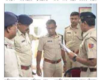
অভিযুক্ত যুবকের বাড়িতে যায় প্রতিবাদ জানাতে। অভিযোগ সেই এমনকি তার মামার হাতে হাঁসুয়ার কোপ মারে বলেও অভিযোগ। তরুণির পরিবারের পক্ষ থেকে

হরিশ্চণ্ডেপুর পানায় লিখিত অভিযোগ দায়ের করা হয়েছে। এলাকাবাসীর অভিযোগ ওই যুবক এলাকায় দীর্ঘদিন মুস্তানি করে।এর আগেও ওই তরুণী সহ এলাকার আচেও ওহ ওম্পা সহ অধাবান অনেক মেয়েদের কটুক্তি করেছে। অভিযুক্ত যুবকের শান্তির দাবি জানিয়েছে এলাকার মানুষ। তকুণীর মামা বলেন, আমার ভাগ্নিকে কটুন্তি করেছিল কু-প্রস্তাব দিয়েছিল। আমরা ওর বাড়িতে বলতে গেলে আমাদের মারধর করে। আমার স্তীর হাতে আঘাত ক্ষো আমার হাতে আমার লেগেছে। আমার হাতে অসুয়ার কোপ মেরেছে। স্থানীয় বাসিন্দা জানান, ওই যুবক এব আগেও এই ধবনের ঘটনা ঘটিয়েছে। মাঝে মাঝে এলাকার মেয়েদের কটুন্ডি করে। এদিন প্রতিবাদ করতে গেলে এই অবস্থা। আমরা চাইছি পুলিশের