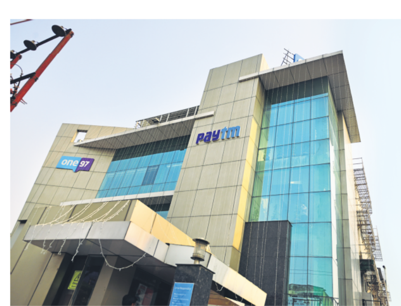
On 31 January, RBI barred Paytm Payments Bank from accepting customer deposits after the end of February, which was later extended to 15 March.

take a 20% pay cut as the value of ESOPs (employee stock ownership plan)included in the overall cost to company or CTC-eroded over time. Paytm has lost more than half of its market value since RBI clamped down on its payments bank in January, showed data from Bloomberg.