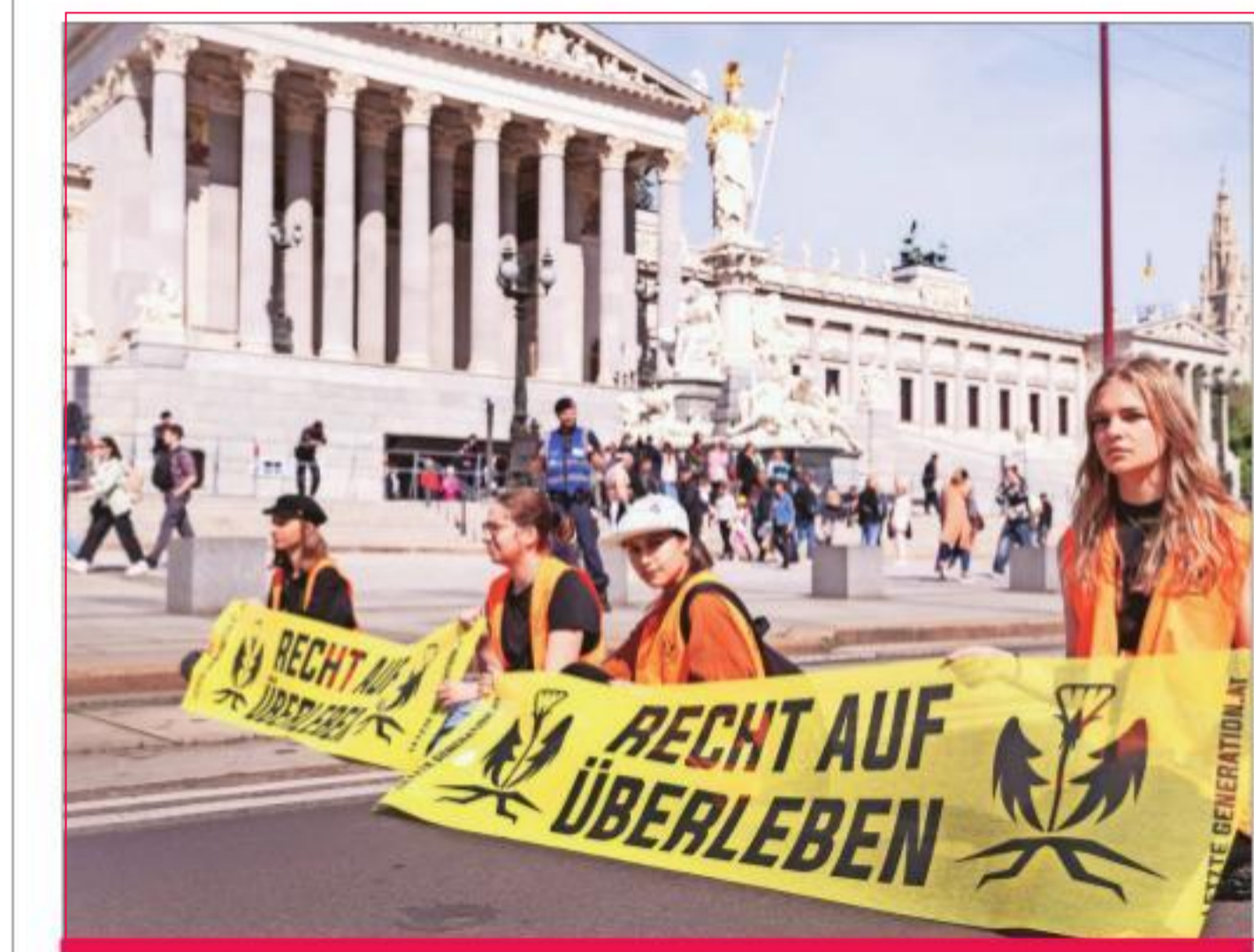
Activists of the 'Letzte Generation' (Last Generation) protest on the street in front of the Parliament for climate protection in Vienna, Austria