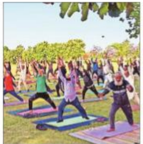
People perform yoga at a park in Islamabad

AFTER MAKING GLOBAL headlines, the ancient Indian physical, mental and spiritual practice of yoga has officially arrived in neighbouring Pakistan. According to the official Facebook page of the Capital Development Authority (CDA), which is responsible for the upkeep of Islamabad, the Metropolitan Corporation of Islamabad has launched "Free yoga classes in F-9 Park" in the capital. "Many people have already joined in to kickstart their journey towards health and well-