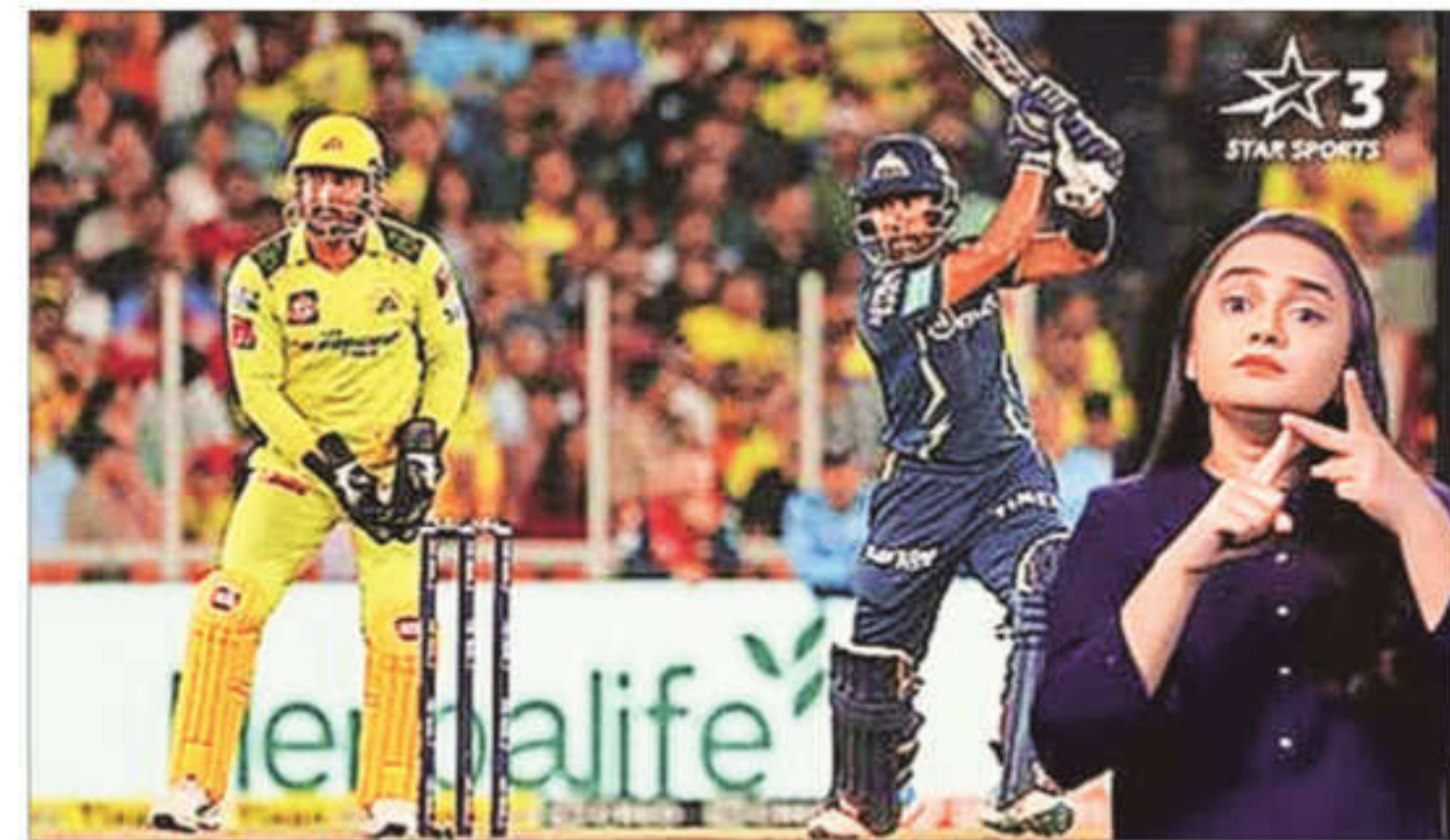
In a first for live sports broadcasting, Star Sports has added sign language interpretation to its IPL feed