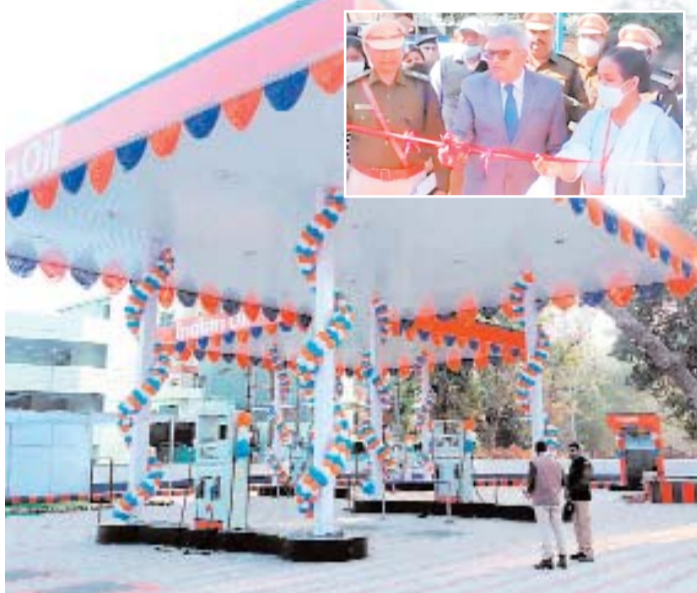
इंडिया ऑयल के सहयोग से बनाया गया है। यह मद्र के जेल विभाग का पहला पेट्रोल पंप है। पेट्रोल पंप पर वह सभी सुविधाएं रहेंगी, जो अन्य पेट्रोल पंप पर रहती हैं। पेट्रोल और डीजल को दरें भी वहां रहेंगी। बस पेट्रोल पंप शुरू करने