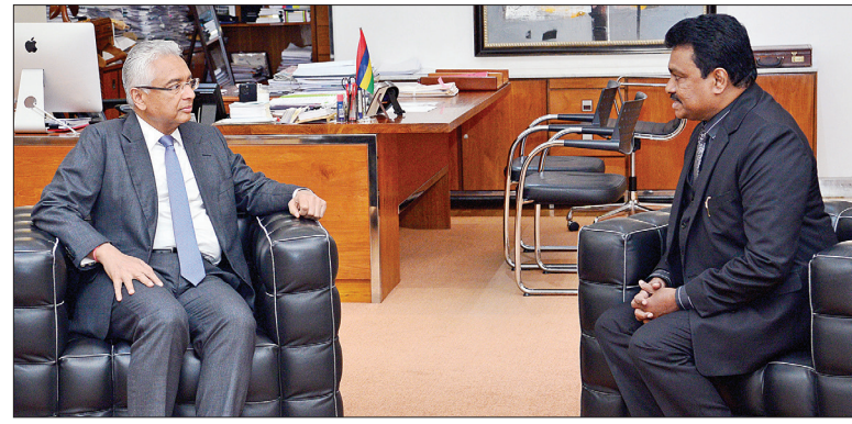
மொரிசியஸ் பிரதமர் பிரவீந்த் குமார் ஜகநாதத்தை, அவரது அலுவலகத்தில் மொரிசியஸ் நாட்டின் தமிழகத்துக்கான கரவர தூதர் மலையப்பன் சந்தீத்தார். அப்போது தமிழகம் - மொரிசியஸ் இடையிலான வர்த்தக வாழ்புகள் மற்றும் கருத்துகளை இருவரும் பகிர்ந்து கொண்டனர்.

மின்சார ரயில்கள், மீஞ்சூர் - கும்மிடிப்பூண்டி இடையே பகுதி ரத்து செய்யப்பட உள்ளன. கும்மிடிப்பூண்டி - சென்னை சென்ட்ரலுக்கு மார்ச் 28, 30, 31 ஆகிய தேதிகளில் காவல் 9.55 மணிக்கு புறப்பட வேண்டிய மின்சார ரயில், கும்மிடிப்பூண்டி - மீஞ்சூர் இடையே பகுதி ரத்து செய்யப்பட உள்ளது. சென்னை சென்ட்ரல் - கும்மிடிப்பூண்டிக்கு மார்ச் 28, 30, 31 ஆகிய தேதி காவல் 9.40 மணிக்கு புறப்படும் மின்சார ரயில், எண்ணூர் - கும்மிடிப்பூண்டி இடையே பகுதி ரத்து செய்யப்பட உள்ளது. கும்மிடிப்பூண்டி - சென்னை கடற்கரைக்கு மார்ச் 28, 30, 31 ஆகிய தேதிகளில் காவல் 10.55 மணிக்கு புறப்பட வேண்டிய மின்சார ரயில், கும்மிடிப்பூண்டி - மீஞ்சூர் இடையே பகுதி ரத்து செய்யப்படும்.