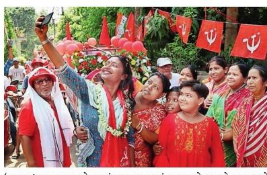
'माकप'च्या तरुण उमेदवारांकडून मतदारांना साकडे घातले जात आहे.