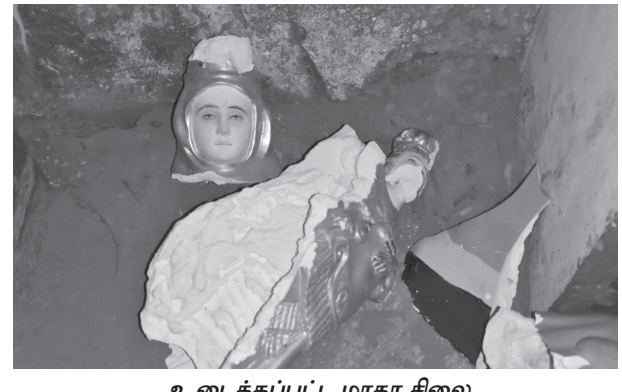
உடைக்கப்பட்ட மாதா சிலை

தண்டையார்பேட்டை, பிப். 4- சென்னை புதுவண்ணாரப்பேட்டை-திருவொற்றியூர் நெடுஞ்சாலையில் நகருணை ஆலயம் செல்லும் வழியில் மாதா சிலை உள்ளது. இந்நிலையில் நேற்று நள்ளிரவு மர்ம நபர் இருப்பு கம்பியால் மாதா சிலையை சேதப்படுத்தியுள்ளார். இதை பார்த்து அப்பகுதியினர் கூச்சலிடவே மர்மநபர் தப்பி ஓடிவிட்டார். இதுகுறித்து புதுவண்ணார விசாரணை நடத்தினர்.