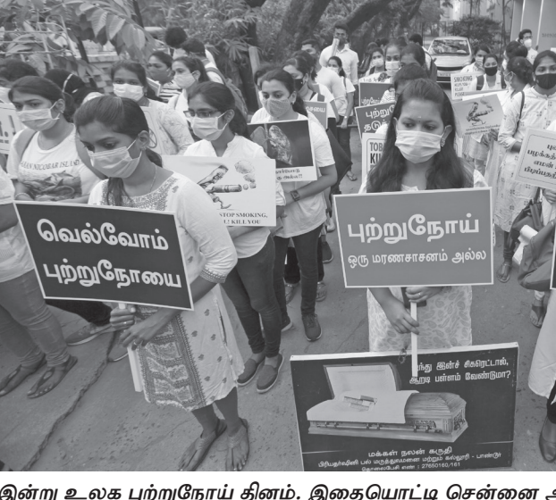
இன்று உலக புற்றுநோய் தினம். இதையொட்டி சென்னை அடையாறு புற்றுநோய் மருத்துவமனையில் இருந்து புதிய மருத்துவமனை வரை, விழிப்புணர்வு வாசகங்கள் அடங்கிய பதாகைகளுடன் முதுநிலை மருத்துவ மாணவர்கள் உரவலமாக சென்றனர்.

மறியலில் ஈடுபட்டனர். அப்போது, மாதா சிலையை உடைத்த மர்மநபரை விசாரணை நடத்தினர். இதை பார்த்து அப்பகுதியினர் கூச்சலிடவே மர்மநபர் தப்பி ஓடிவிட்டார். இதுகுறித்து புதுவண்ணார விசாரணை நடத்தினர். இதை பார்த்து அப்பகுதியினர் கூச்சலிடவே மர்மநபர் தப்பி ஓடிவிட்டார். இதுகுறித்து புதுவண்ணார விசாரணை நடத்தினர்.