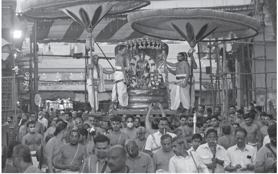
சென்னை திருவல்லிக்கேணி பார்த்தசாரதி கோயிலில் பிரமோற்சவத்தை முன்னிட்டு, இன்று காலை சேஷ வாகனத்தில் பெருமான் வீதிபுலா வந்தார்.