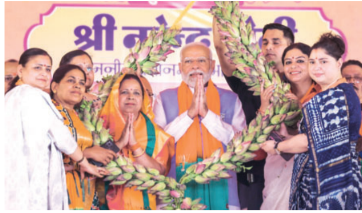
बाराबंकी में प्रधानमंत्री नरेंद्र मोदी ने चुनावी सभा को संबोधित किया

बाराबंकी में प्रधानमंत्री मोदी ने समाजवादी पार्टी और कांग्रेस पर हमला बोलते हुए कहा कि ये लोग सरकार में आए तो रामलला को फिर टेंट में भेज देंगे और राम मंदिर पर बुलडोजर चला देंगे। उन्होंने कहा कि इन लोगों को योगी जी से ट्यूशन लेना चाहिए कि कहा बुलडोजर चलाना चाहिए। मोदी ने कहा कि कांग्रेस सरकार ने कर्नाटक में मुसलमानों को रातोरात ओबीसी बना दिया और पिछड़े आरक्षण से वंचित रह गए। उन्होंने कहा कि ये लोग अब इसी मॉडल को पूरे देश में लागू करना चाहते हैं और संविधान बदलकर दलितों-पिछड़ों की पूरा आरक्षण मुसलमानों को देना चाहते हैं। फतेहपुर की रैली में प्रधानमंत्री ने कहा कि कांग्रेस और सपा भ्रष्टाचार के लिए राजनीति में हैं। उन्होंने कहा कि दोनों पार्टियां